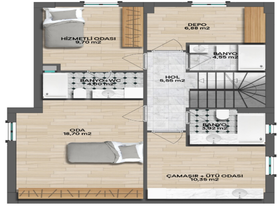
LAKE VILLAS BODRUM KAT PLANI