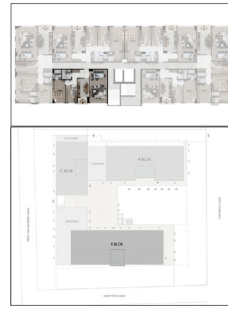
B BLOK NORMAL KAT TİP PLANI

A BLOK OFİS (1,9,17,25,33,41,49,57,65,73) NET: 50,60 M2 BRUT: 73,37 M2 1 HOL+ANTRE: 4,70 M2 2 AÇIK OFİS: 34,56 M2 3 MUTFAK: 5,06 M2 4 BANYO: 6,28 M2