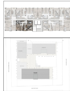
B BLOK NORMAL KAT TİP PLANI

A BLOK OFİS (1,9,17,25,33,41,49,57,65,73) NET: 50,60 M 2 BRÜ: 73,37 M 2 1 HOL+ANTRE: 4,70 M 2 2 AÇIK OFİS: 34,56 M 2 3 MÜTFAK: 5,06 M 2 4 BANYO: 6,28 M 2