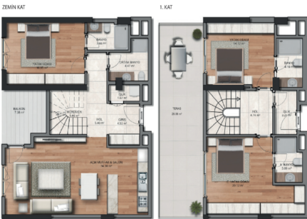
ÇD 3.2.1 TERASLI