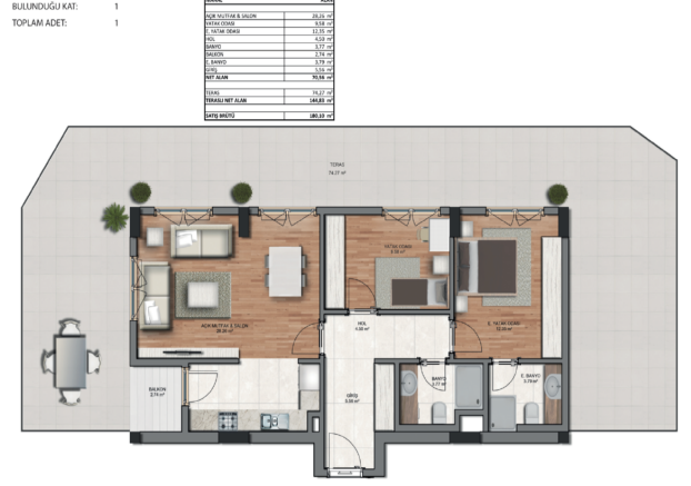
SD 2.2.1 TERASLI