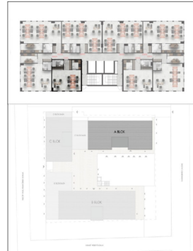
A BLOK OFİS ZEMİN KAT TİP PLANI

B BLOK 2+1 DAİRE (1,7.13.19.25.31, 37.43.49.55) NET: 81,10 M2 BRUT: 117,40 M2 1 HOL: 9,80 M2 2 SALON: 27,00 M2 3 MÜTFAK: 11,00 M2 4 BANYO: 4,30 M2 5 E. YATAK ODASI: 13,10 M2 6 E. BANYO: 3,65 M2 7 YATAK ODASI: 9,30 M2 8 BALKON: 2,95 M2